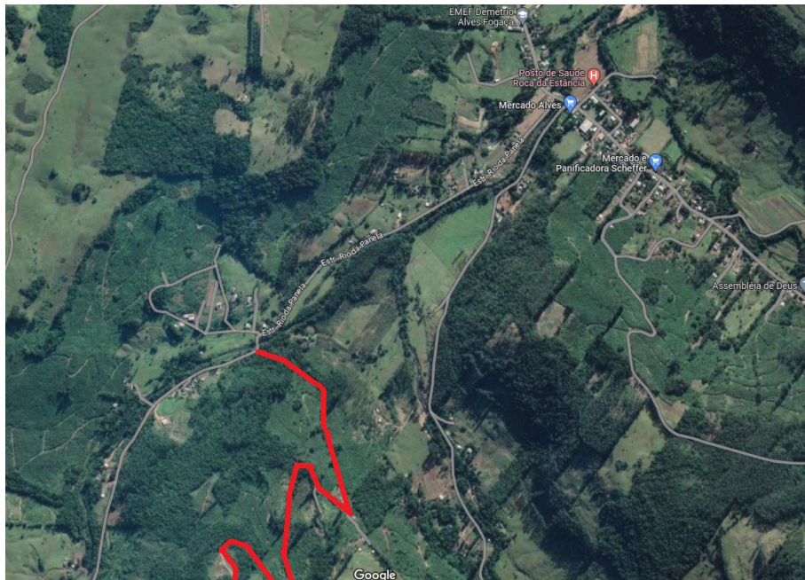
Ponto inicial da estrada a ser nomeada, com início na Estrada Municipal Alicio Euviro da Silva.